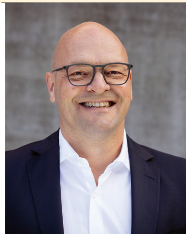
Region Südwest Bajo Heeren Beratung & Vertrieb & Service • Tover GmbH

+ 49 4765 8311 850 a.angrabeit@nodits.de